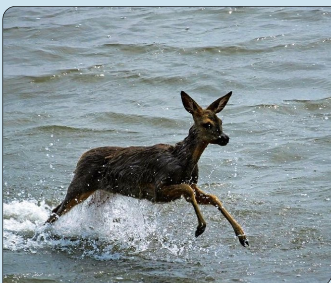
Ein Reh in der Nordsee. Ein Schnapshot, der einem nicht alle Tage gelingt.