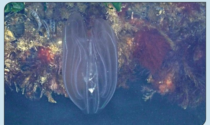
Im Hafenbecken entdeckte Hillmann diese Melonen-qualle.