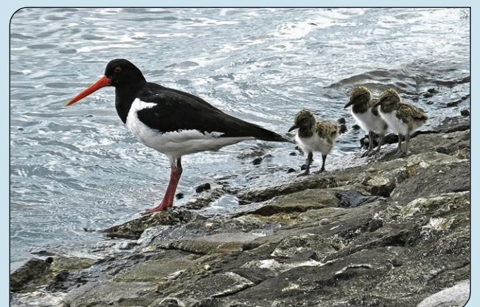
Familie Austernfischer am Südstrand.