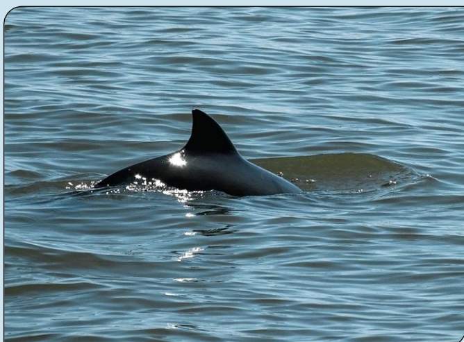
Die Finne eines Schweinswals