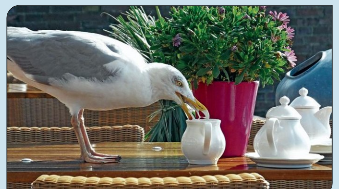
Ebenfalls ein Schnapshot. Diese Möwe beim Milch-schlürfen.